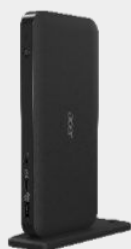
Acer USB Type-C Dock III