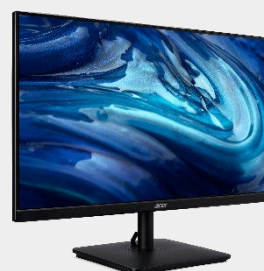
Moniteur 24" ZeroFrame FHD VA2 series