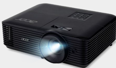
Projecteur 4,500 Lumens SVGA X1128HK